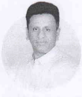
Dr. M.C. Sudhakar Hon'ble Minister for Higher Education Government of Karnataka