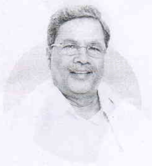
ಶ್ರೀ ಸಿದ್ದರಾಮಯ್ಯ ಮಾನ್ಯ ಮುಖ್ಯಮಂತ್ರಿಗಳು, ಕರ್ನಾಟಕ ಸರ್ಕಾರ