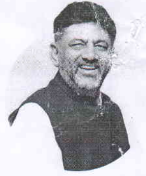
ಶ್ರೀ ಡಿ.ಕೆ. ಶಿವಕುಮಾರ್ ಮಾನ್ಯ ಉಪ ಮುಖ್ಯಮಂತ್ರಿಗಳು, ಕರ್ನಾಟಕ ಸರ್ಕಾರ

ಉನ್ನತ ಶಿಕ್ಷಣ ಇಲಾಖೆ ಮತ್ತು ಅಜೀಂ ಪ್ರೇಮ್‌ಜಿ ಫೌಂಡೇಶನ್ ಸಹಯೋಗದೊಂದಿಗೆ