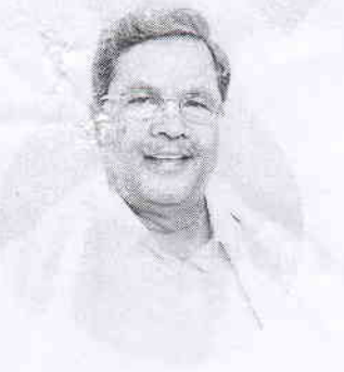
Shri Siddaramaiah Hon'ble Chief Minister Government of Karnataka