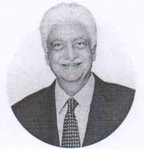
Shri Azim Premji Hon'ble Chairman, Azim Premji Foundation

Lighting the Path for Leaders of Tomorrow