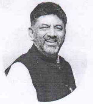
Shri D.K. Shivakumar Hon'ble Deputy Chief Minister Government of Karnataka

Department of Higher Education And Azim Premji Foundation Collaboratively Institute Scholarship