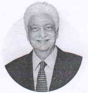
ಶ್ರೀ ಅಜೀಂ ಪ್ರೇಮ್‌ಜಿ ಮಾನ್ಯ ಅಧ್ಯಕ್ಷರು ಅಜೀಂ ಪ್ರೇಮ್‌ಜಿ ಫೌಂಡೇಶನ್

ವಿದ್ಯಾರ್ಥಿನಿಯರ ಶಿಕ್ಷಣಕ್ಕಾಗಿ ನೆರವು; ನಾಡಿನೊಳಗೆ ಸಮೃದ್ಧಿಯ ಹರಿವು